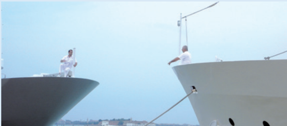
Venetië, 2009.

Tegen het einde van deze regeringsvorm gaven Le Nove de kunstenaar Ambrogio Lorenzetti de opdracht een fresco te maken in de zaal waar ze beraadslaagden. L'Allegoria ed Effetti del Buono e del Cattivo Governo verbeeldt het principe van gerechtigheid en algemeen welzijn: 'goed' en 'slecht' bestuur en de gevolgen van elk voor een samenleving. Aangebracht op drie muren is het een van de grootste fresco's ooit geschilderd.